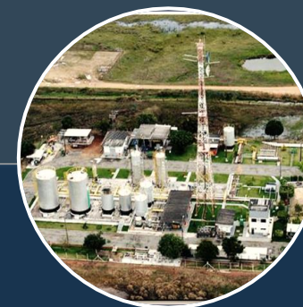
FELTKLYNGE NORTE CAPIXABA